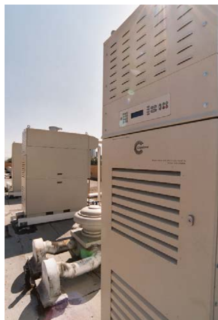
Instalación de tres microturbinas C60 Capstone con recuperador de calor integrado en el hotel Atrium del aeropuerto Orange County (California, EE.UU.). Uno de los principales objetivos era optimizar el gas natural para proporcionar agua caliente y calefacción a las 214 habitaciones de que dispone el complejo. Los ahorros anuales de esta instalación, tanto en gas natural como en electricidad, ascienden a 139.000 dólares.

Estas instalaciones pueden actuar con equipos convencionales, evitando la instalación de equipos redundantes para garantizar la disponibilidad del servicio. Además, pueden utilizarse como sistemas de emergencia, aguantando las cargas críticas en caso de fallo en el suministro eléctrico. En este caso estamos eliminando la inversión en el generador de emergencia por lo que los resultados económicos aún serán mejores.